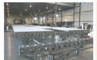
▲ Atelier de décor complet