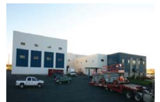
▲ Les équipes de construction quittent et les équipes de production arrivent