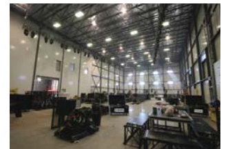
▲ 40' de libre sous les poutrelles 4000 lbs d'accrochage par poutrelle