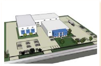
▲ Studio et atelier de décors