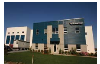
▲ Le Studio est adjacent à l'atelier de Scène Éthique