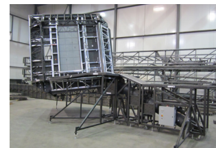
En montage pour répétition dans le Studio SE