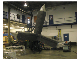
Poutres montées sur le support