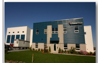
▲ Le Studio est adjacent à l'atelier de décors