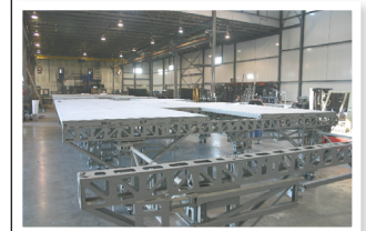
▲ Atelier de décor complet