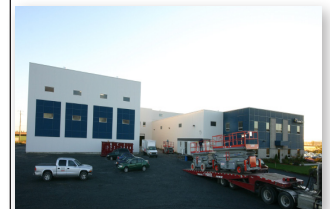
▲ Les équipes de construction quittent et les équipes de production arrivent