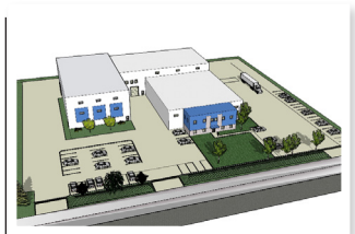
▲ Studio et atelier de décors